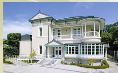
建学記念館 錦華殿