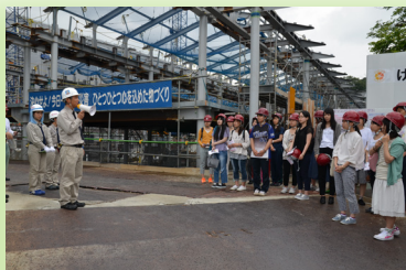
工事ゲート前に集合し、オリエンテーションを行いました。