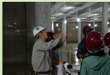
初めて見るものも多く、参加者からの質問が絶えませんでした。