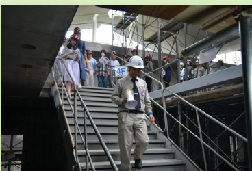
そして「知恵の蔵」の地下に向かいます。