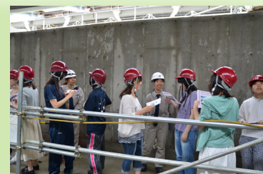
建設現場で働く女性社員から説明がありました。