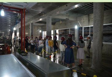
地下ではコンクリート床の他、免震装置も見学しました。