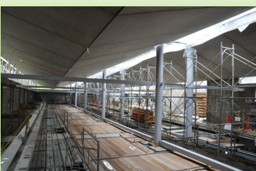
プレキャストコンクリートで作られた屋根を見学しました。