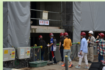
そして「知恵の蔵」の中へと進みます。