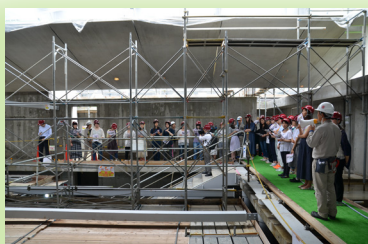
仮設の階段を上り「知恵の蔵」の最上階に行きました。