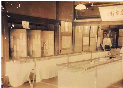
昭和 25 年の遺墨展の様子