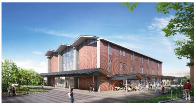
図書館側からの外観

新校舎は、地下1階に学園講堂、1階に礼拝堂、カフェテリアなど、2階にデータサイエンス学部関係諸室、3階に役員室や会議室、応接室などを配置し、新設学部と学園本部の中枢機能を兼ね備えた施設となります。また、学園講堂は学園最大規模となる600人を収容可能とし、イベントホールとして式典や各行事の利用を見込んでいます。