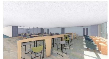
データサイエンス学部専用フロア ラウンジ