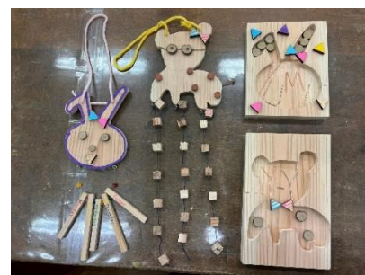
2023 年度参加の小学生の作品