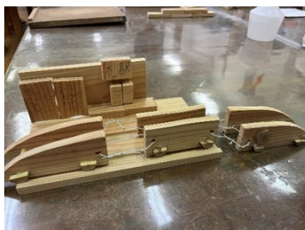
2023 年度参加の小学生の作品

夏休みに開催する「親子でつくる木工作－木育のすすめ－」では、“木に触れ、木に学び、木と生きる”といった「木育」を、事前募集した小学生 15 組の親子が制作を通じて交流・探求することによって互恵的に学び合いながら、木のおもちゃの完成を目指します。