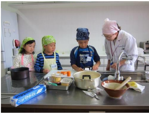
献立：ちくぜん煮・ごまあえ・なすの田楽味噌・すまし汁・フルーツポンチ

また子どもたちからも「すごく楽しかった。また来たい」、「みそのおじみがおいしかった」、「ごまをするところが楽しかった」等の声が寄せられました。