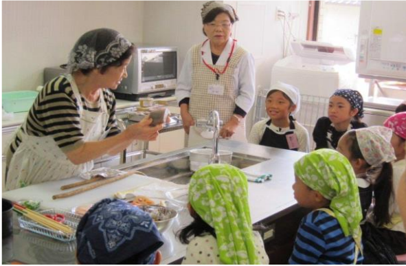
東山区地域女性会の皆さんから学ぶ料理の知恵

京のおばんざい料理を地元の地域女性会の皆さんから直接学べる機会として楽しく交流しながら過ごしました。子どもたちはこんなにやくのみちぎりが、ごぼりの皮処理や乱切りの体験の他、すり鉢でのごますりや田楽味噌の味見、盛り付けをして、みんなで賑やかに食事をしました。