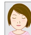
目を閉じているもの